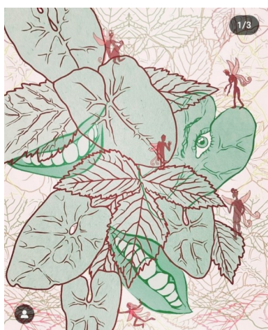
dessin de Camille Pier